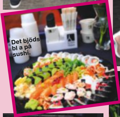
Det bjöds bl a på sushi.