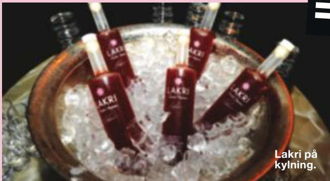
Lakri på kylning.

● Att smaksätta sprit och vodka är sannerligen inget nytt. Men kombinationen lakrits/hallon lär vara en ny smaksättning och den svenskproducerade vodkan Lakri med undertiteln Swedish Perfection föll sannerligen gästerna på läppen när den nyligen lanserades med flärdfullt buller och bång.