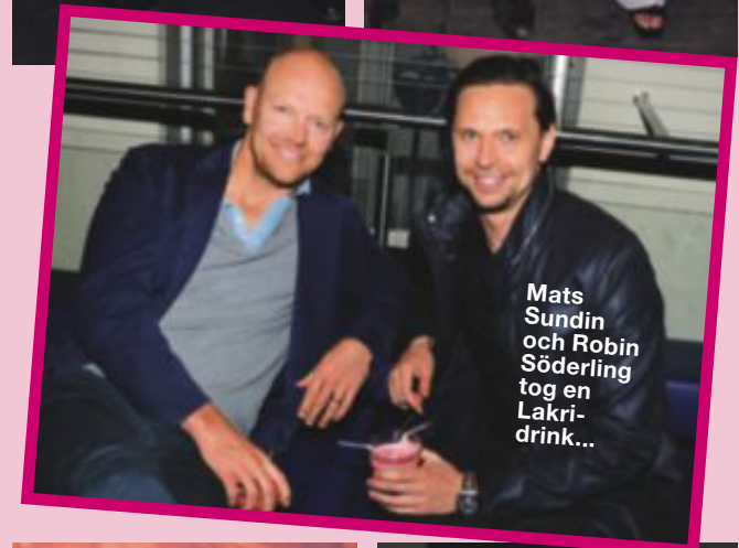
Mats Sundin och Robin Söderling tog en Lakri-drink...